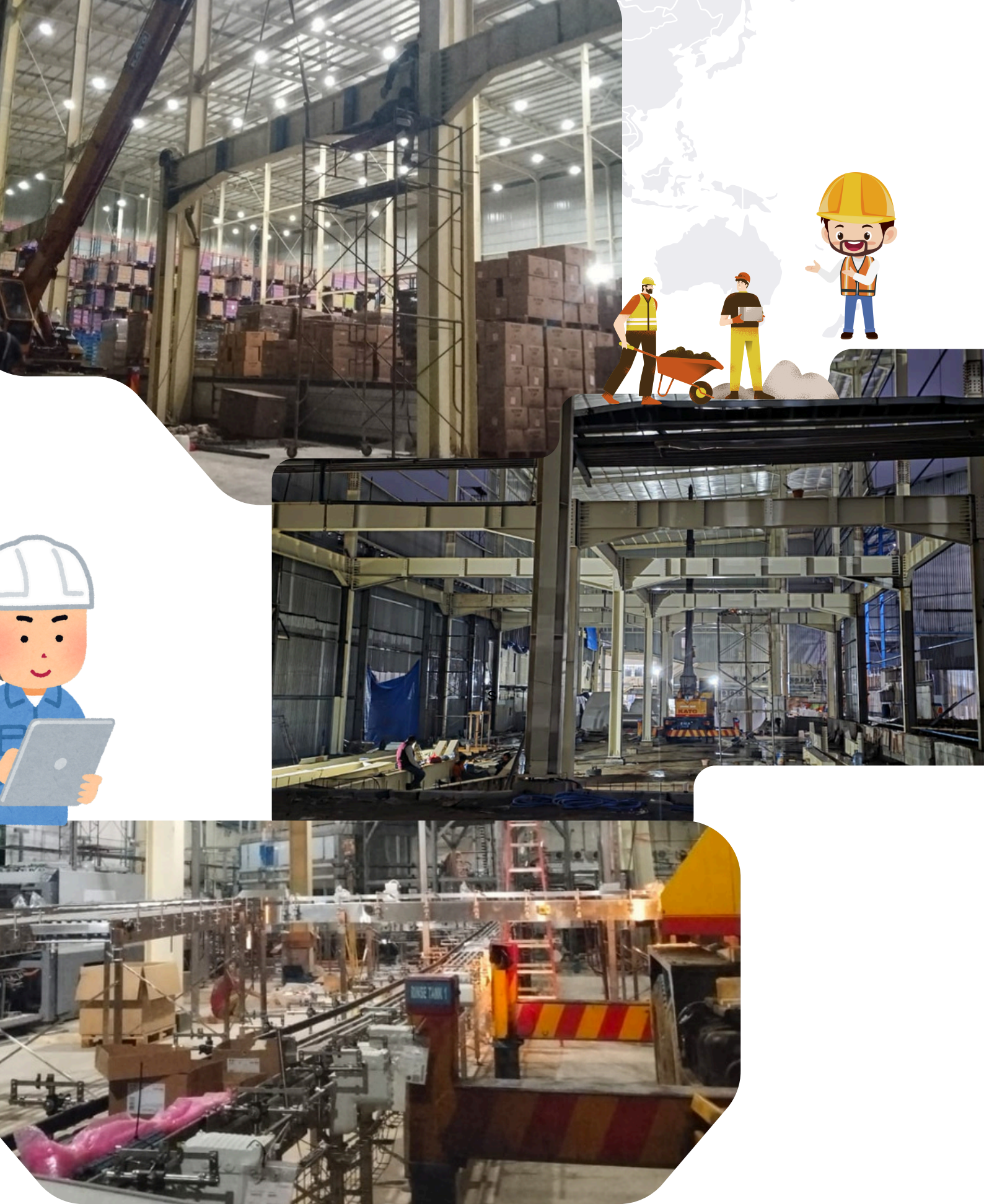
Project Pembangunan Pabrik Air Minum Nestle PT. Akasha Wira Internasional Lok. Cibinong, Jawa Barat