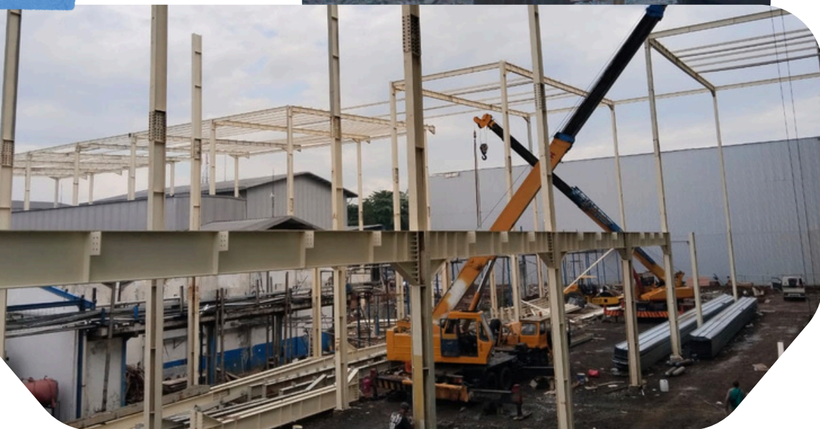
Project Pembangunan Pabrik Air Minum Nestle PT. Akasha Wira Internasional Lok. Cibinong, Jawa Barat