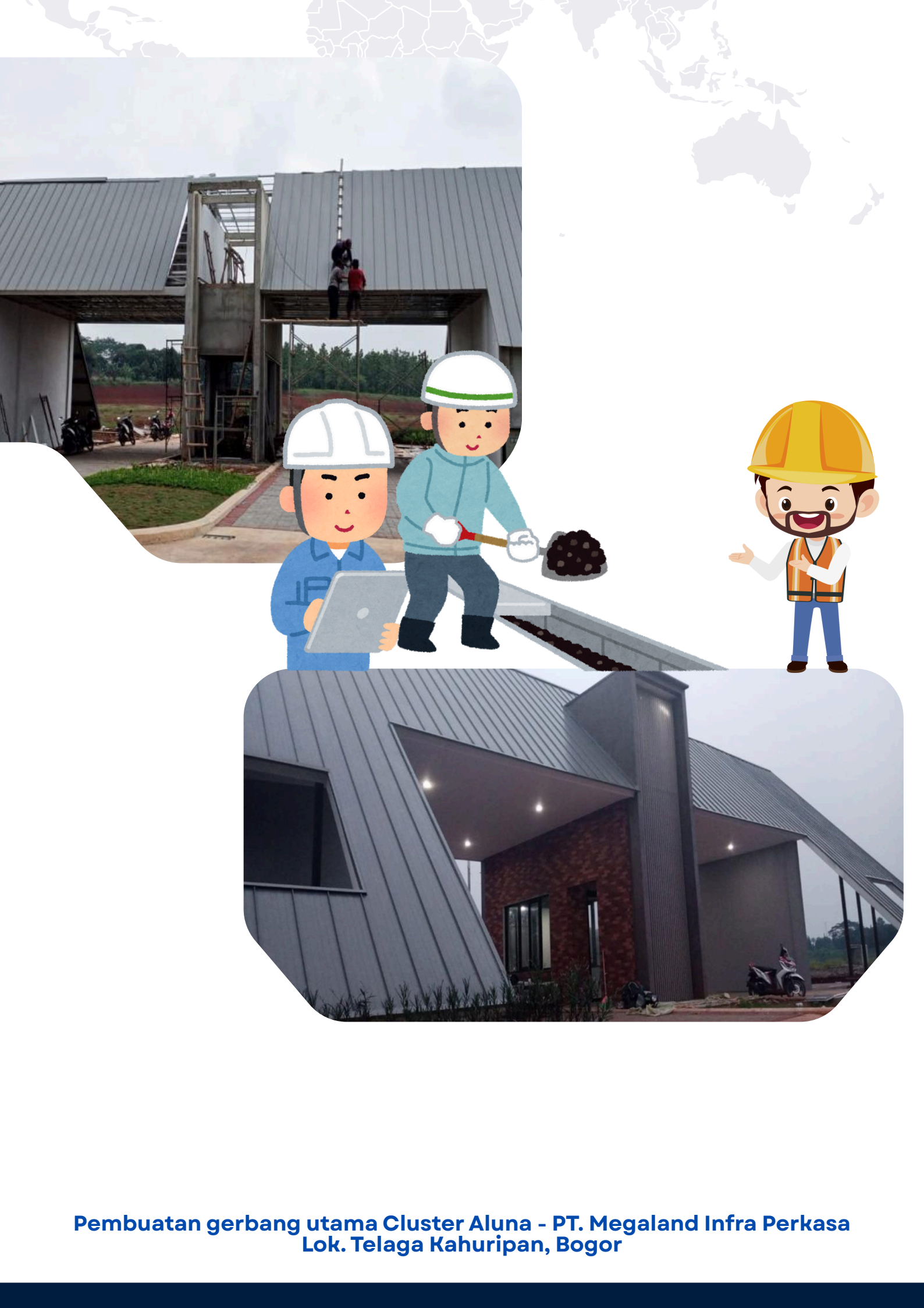
Pembuatan gerbang utama Cluster Aluna - PT. Megaland Infra Perkasa Lok. Telaga Kahuripan, Bogor