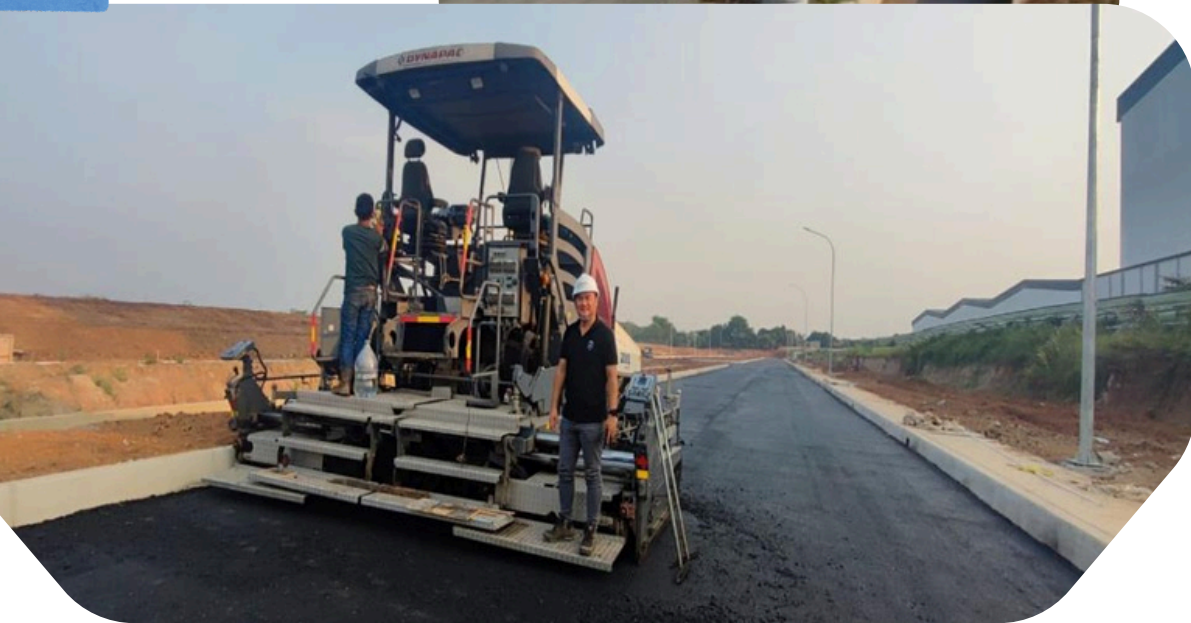
Project Main Road Access Pabrik Susu Ultra instalasi air bersih dan air kotor, kanal irigasi dan penerangan jalan utama - PT. Megaland Infra Perkasa Lok. Kawasan MM2100