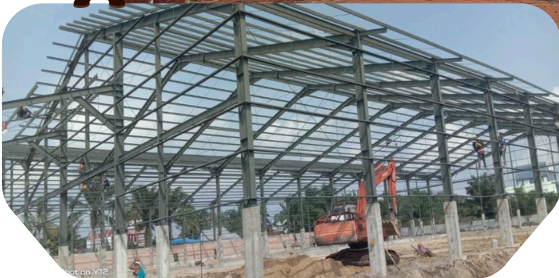
Pembuatan Pabrik Akrilik PT. TODA - PT. Megaland Infra Perkasa Lok. Perigi Mekar, Kab. Bogor